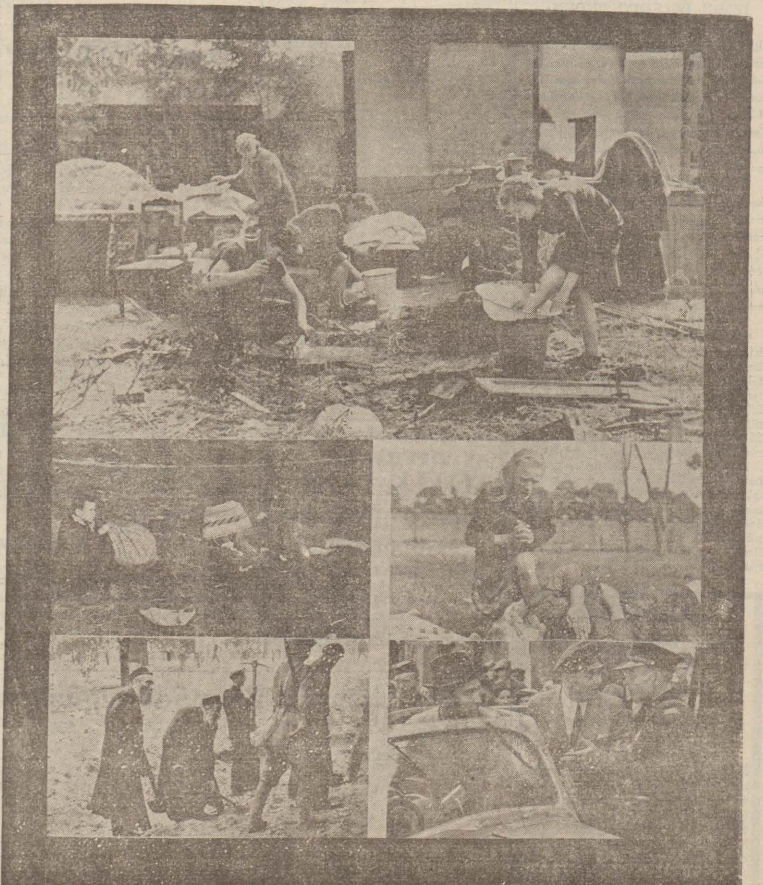
Varşovada bugünkü feci hayattan bir kaç enstantane: Enkaz yığı halindeki evlerde nasıl yaşıyorlar? Sokak ortalarında can verenler, harabe yığınlarını temizlemek için Alman askerlerinin nezareti altında cebren çalıştırılan ihtiyar Yahudiler.

Londra, 7 (Ö.R) — Alman Polonyasından Lublin istikametine kaçan Yahudi kafilelerin fevkalâde feci vaziyetinden merhamete dilenirken, bu-