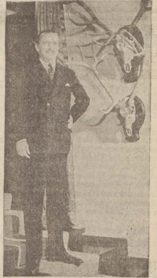
Finlandiya Başkumandanı Mannerhaym

Brüksel, 7 (Ö.R.) — Helsenkiden bildirildiğine göre Fenlandiya hükümeti Moskovadaki delegelerinden gelen raporların tedkikine devam etmektedir. Delegeler Moskovada İsveç sefiri tarafından kabul edilmiş ve Moskova belediyesi tarafından şereflerine tertip edilen şenlikte hazır bulunmuşlardır.