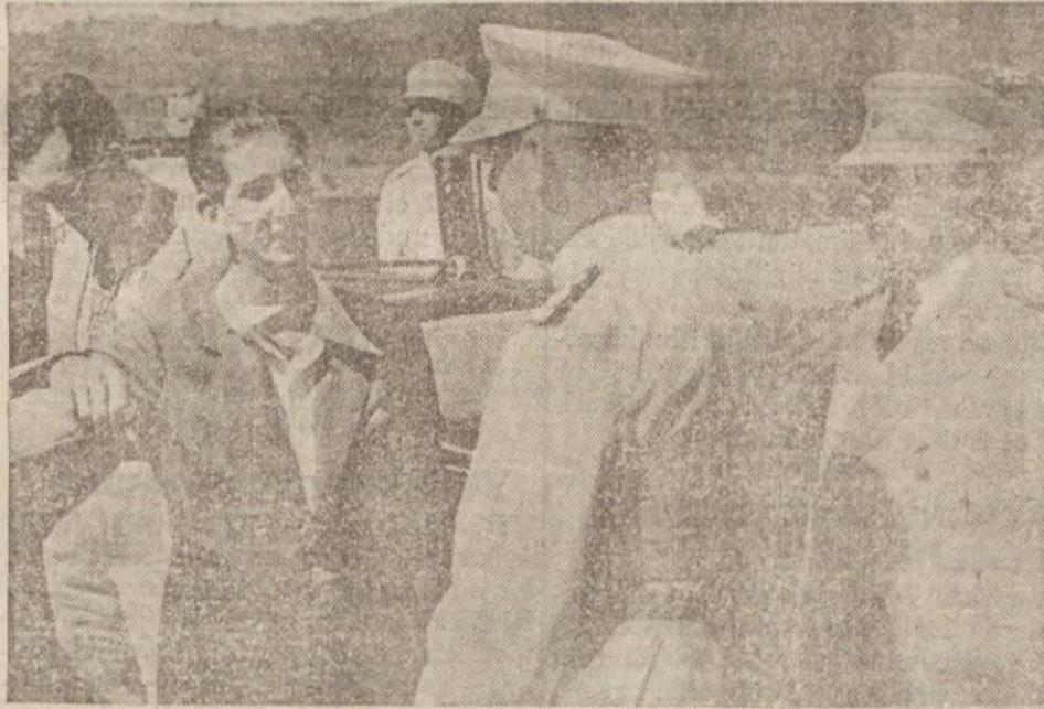
Genç Yugoslav Kralı Yugoslav zabitleriyle konuşuyor

Londra, 7 (Ö.R.) — Türkiye Hariciye Vekili E. Şükrü Saracoğlu «Neahellasi» Yunan gazetesine beyanatında Türkiye ile Yunanistanın sulhververane maksadlar takip etmekle beraber, müttefiklerini - tehdid edildiği takdirde - müdafaa azminden olduklarını söylemiş ve bu hususta hiç bir şüphenin mümkün olmayacağını manidar bir şekilde ilâve eylemiştir.